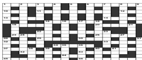
Кроссворд тематический «Компьютерный».

Кроссворд может быть как простой, так и тематический (реальное заполнение вопросами и определениями по заданной теме близко к 100 %). До 15-25 % от общего количества в кроссворд могут быть введены ключевые слова. Сетка кроссворда симметричная, за исключением тех случаев, когда приходится составлять сложный тематический кроссворд.