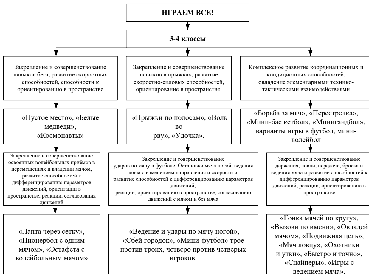
Рисунок 1 – Примерное содержание курса по физической культуре «Играем все!» для обучающихся 3-4 классов

В процессе изучения... выявлено, что... Разработано содержание экспериментальных... для ...классов, основанных на... (Рис. 1).