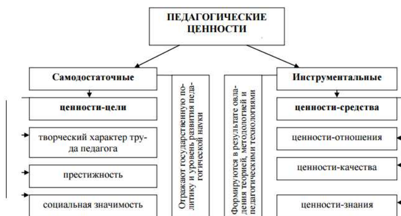
Рисунок 2 - Классификация педагогических ценностей (по В.А. Сластенину)

Страницы следует нумеровать арабскими цифрами, соблюдая сквозную нумерацию по всему тексту ВКР. Номер страницы проставляют в центре нижней части листа без точки. Титульный лист включают в общую нумерацию страниц ВКР. Номер страницы на титульном листе не проставляют. Иллюстрации и таблицы, расположенные на отдельных листах, включают в общую нумерацию страниц.